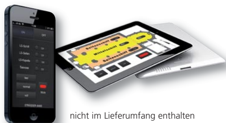
nicht im Lieferumfang enthalten

19"-Winkel und Netzanschlusskabel im Lieferumfang enthalten